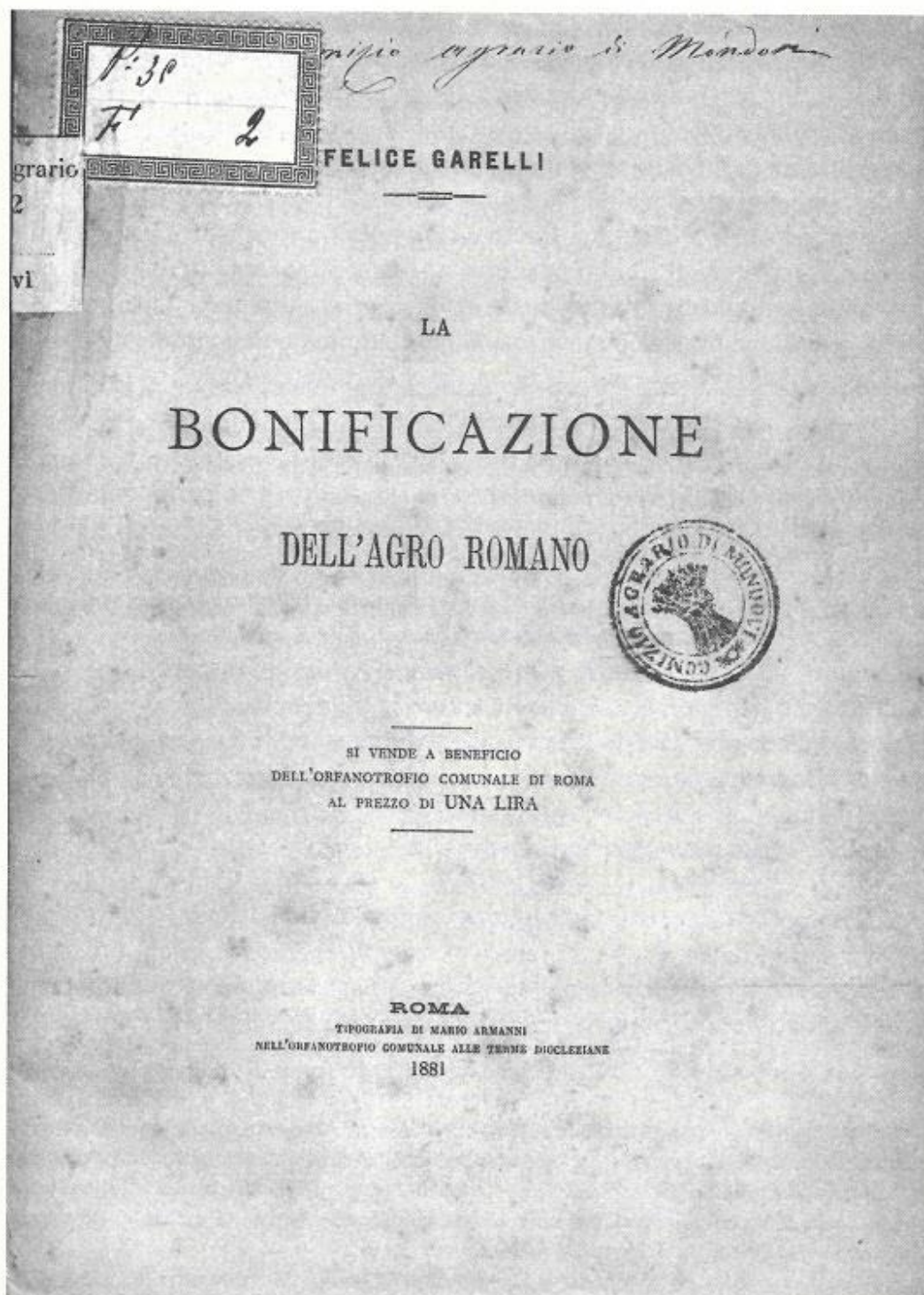
F. GARELLI, La bonificazione dell'agro romano , Roma, Armani, 1881 (copertina)